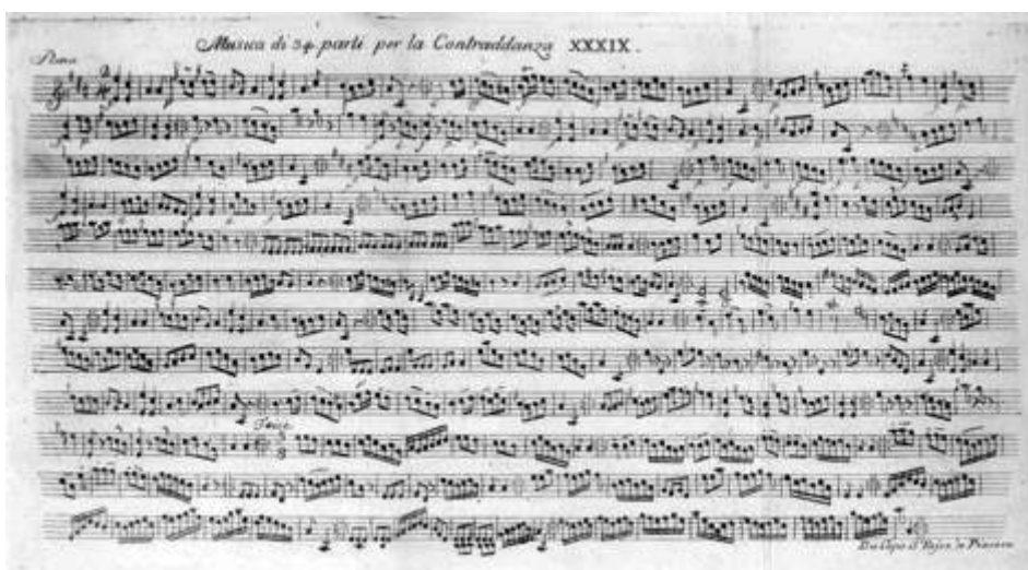
Partitura musicale della Contraddanza XXXIX, in MAGRI Gennaro, Op. cit. , Tavola XXXIX.