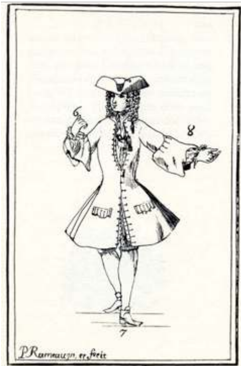
Pierre Rameau, Le Maître à danser , Naissance de l'opposition, p. 218 gallica.bnf.fr/BNF, Département Réserve des livres rares, RES-V-2587